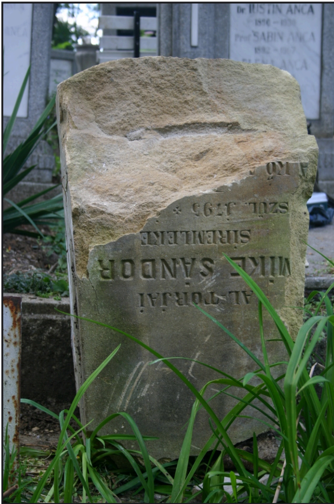
C. Helyreállítás közben