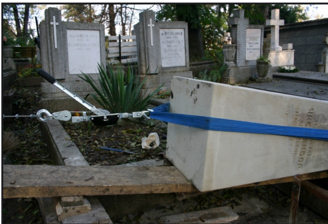
A széttört sírkő darabjait kipótoljuk és a sírkövet újra felállítjuk